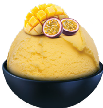
Sorbet Mango-Marakuja Schöllern